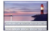
Measurable Future Picture Guiding Precepts

Según Warden, cada anillo es un Centro de Gravedad y a la vez una vulnerabilidad. Plantea que el modelo informa cuáles son los interrogantes que se deben formular, sugiriendo una prioridad para las operaciones. Se debe empezar por los vitales en el centro, hasta los menos esenciales en el exterior. La teoría plantea, además, que al analizar cada anillo en particular, se pueden apreciar otros subsistemas que a su vez tienen cinco anillos. 🐦