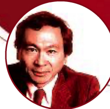
▪ Francis Fukuyama