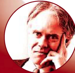
▪ Moritz Leuenberger

septiembre en 2001, diferentes organizaciones y personalidades se han expresado. Al respecto, se puede citar al presidente de Suiza, Moritz Leuenberger, quien ha señalado que "Desde el 11 de septiembre, el mundo se ha convertido en más incierto, más arriesgado." (Artículo «En qué ha cambiado el mundo tras el 11 de septiembre» en: Diario El Mundo , Madrid. Octubre 31- 2001).