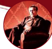
▪ Manuel Castells

Lo anterior, nos muestra el consenso general respecto a que el mundo enfrenta una nueva época llena de incertidumbre e inseguridad, para la cual los Estados y las Organizaciones Internacionales deben prepararse. En especial las Fuerzas Militares, a través de una excelente educación que permita a oficiales y suboficiales estar a la vanguardia del conocimiento, para asumir con éxito los retos del Siglo XXI.