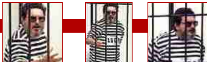
▪ Abimael Guzmán capturado

de Lima, que había vivido mucho tiempo a espaldas del proceso terrorista. Así, la población limeña y los dirigentes políticos tomaron conciencia de lo que estaba sucediendo en el resto del país.