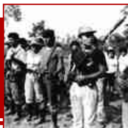
• Sendero Luminoso

Estuve en 1983 en esa zona, y no me podía explicar cómo no se les podía capturar, y el método era sencillo: la Fuerza Principal se llevaba a la Fuerza Local, hacían su incursión armada, e inmediatamente desaparecían haciéndose pasar como