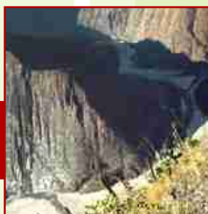
▪ Paisaje de Ayacucho

Por su parte, los inicios del MRTA datan de una marcada tradición guerrillera latinoamericana. Este movimiento se inspira en la revolución cubana, en el Frente Sandinista de Liberación Nacional de Nicaragua, en el Frente Farabundo Martí de El Salvador y en el M-19 colombiano.