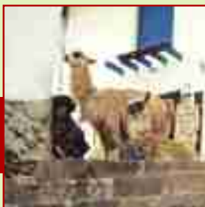
▪ Sitios en Cuzco

Sendero Luminoso es un movimiento subversivo atípico, diferente a todos los que se hayan hecho en el mundo, con el objetivo de la toma del poder y la destrucción del Estado bajo la consigna de batir el campo, es decir, tenía que dejar al Estado completamente acéfalo, sin autoridades y sin ninguna presencia en los territorios, particularmente en la zona andina. Tenía que eliminar a todas sus autoridades de los pueblitos más pequeños, los tenientes gobernadores, los gobernadores, los agentes municipales, la Policía Nacio-