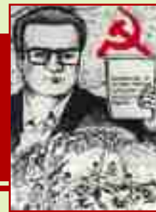
• Propaganda subversiva Senderista

El Frente Unico es el germen de la nueva sociedad. Tenía un elemento que se llamaba el Comité Popular, que se debía instaurar en una comunidad una vez que ya había sido descabezado prácticamente el Estado, incluidas las autoridades civiles y la Policía Nacional. El Comité Popular debería tener la organización del nuevo Estado para instaurar la República Popular de la Nueva Democracia, una organización con comisarios del mismo nivel para toda clase de funciones, desde comisarios secretarios hasta comisarios de seguridad, producción y asuntos comunales. Esta organización del Nuevo Estado se fue instaurando en cada lugar