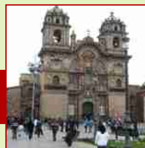
▪ Sitios en Cuzco