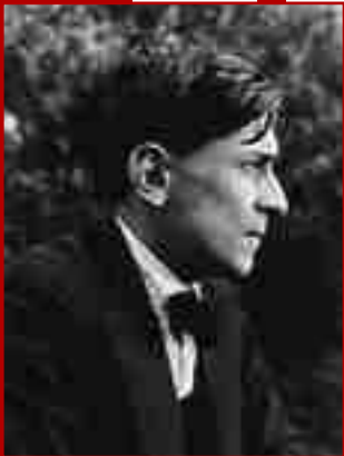
• José Carlos Mariátegui

una tremenda vulnerabilidad, y como veremos posteriormente fue lo que le costó al movimiento Sendero Luminoso gran parte de su derrota.