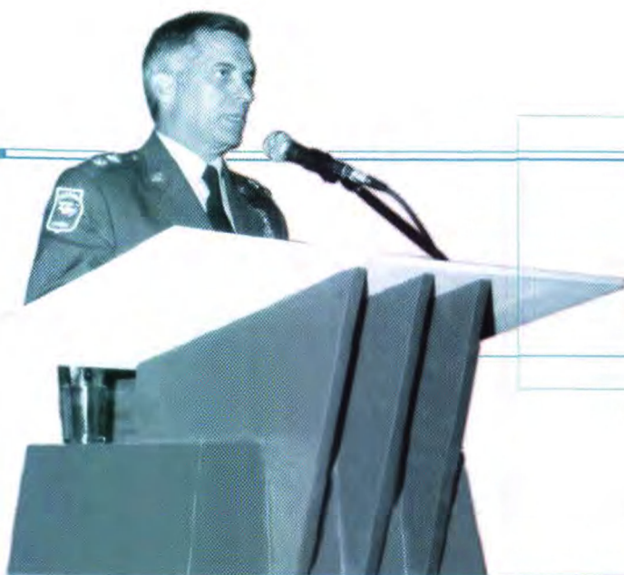
Mayor General Henry Medina Uribe

El general explica que la defensa nacional se define como la integración y acción coordinada del poder nacional para enfrentar y contrarrestar en todo tiempo y lugar todo acto de amenaza o agresión de carácter interno o externo que comprometa la soberanía e independencia de la nación. Esta es deber del Estado y busca establecer en el marco de los derechos humanos y las normas del derecho internacional humanitario la consecución y mantenimiento de la convivencia pacífica y la seguridad ciudadana, que aseguren en todo tiempo y lugar en los ámbitos nacional e internacional la independencia, la soberanía, la autonomía, la integridad territorial y la vigilancia de un orden justo. "Este concepto ha ido evolucionando