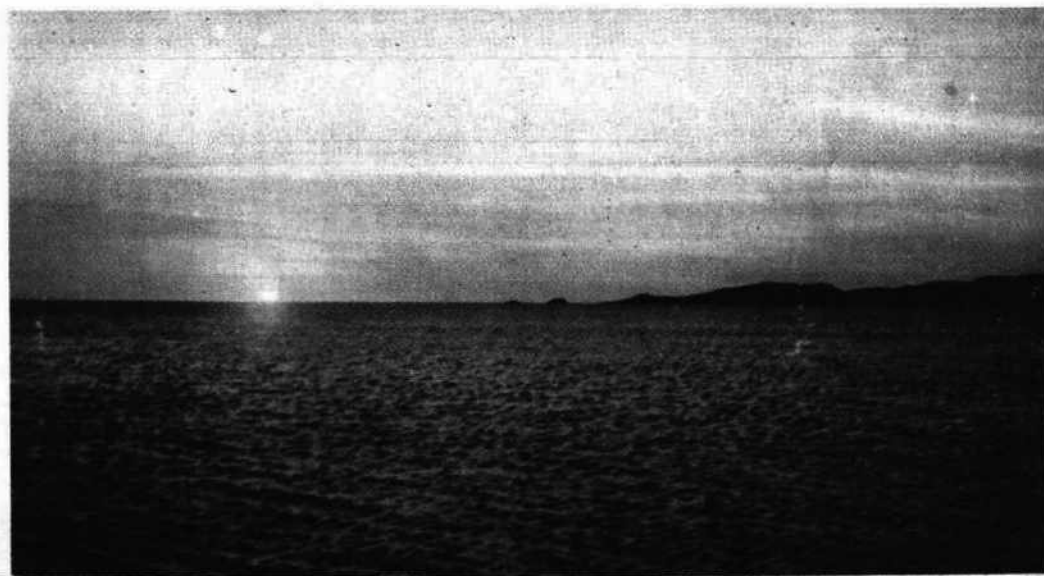
Atardecer en el Mar