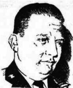
Coronel DIEGO MANRIQUE PINTO