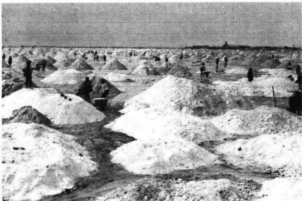
Aspecto parcial de las Salinas