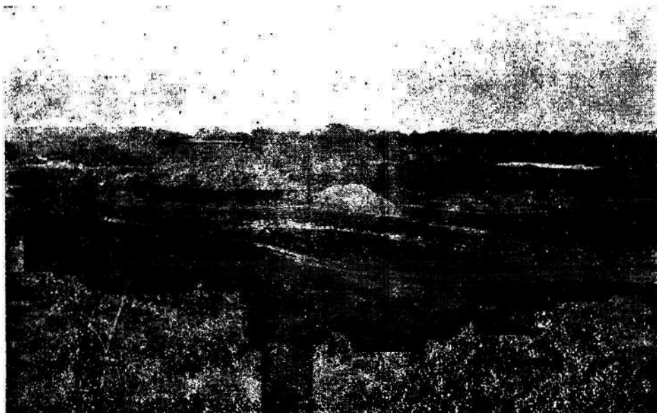
Soldados construyendo un vivero como entrenamiento de práctica en el SENA, Centro Agropecuario de la Sabana.

La estrategia conlleva un aprovisionamiento y almacenamiento de materiales críticos, programa que debe realizar el gobierno con la colaboración