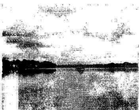
DESEMBOCADURA DEL RIO SAN MIGUEL EN EL PUTUMAYO, TERMINO DEL DISCUTIDO "TRIANGULO DE SAN MIGUEL"

En la segunda mitad del siglo pasado se realizaron numerosas conversaciones entre representantes de los dos países; con el General Julián Trujillo el gobierno ecuatoriano acordó en 1871 el nombramiento de una comisión de geógrafos que recorriera la frontera y trabajara en la delimitación, sin embargo aquella comisión nunca llegó a reunirse; más tarde el General Venancio Rueda intentó lo mismo pero por el hecho de que se firmó otro acuerdo sobre aspectos en que no estaba autorizado, el congreso colombiano se abs-