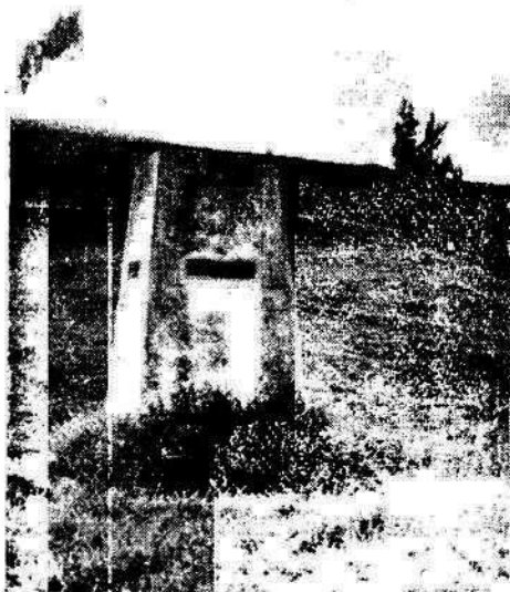
MOJON FRONTERIZO EN LAS CERCANIAS DE LA QUEBRADA DE LOS TEQUES

22. Convención de Arbitraje Andrade-Betancourt. 5 de noviembre de 1904. Desde principios del año, el General Andrade había adelantado conversaciones con el gobierno ecuatoriano sin que hubiera podido llegar a un definitivo acuerdo, finalmente en el mes de noviembre, suscribió la presente convención, por medio de la cual los dos países nombran como árbitro al Em-