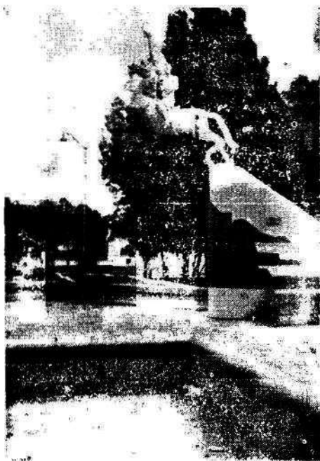
ESTATUA DE ABDON CALDERON EN TULCAN

vicios, la provincia de Túquerres y una fuerte suma de dinero afirmando que así lo había prometido Mosquera. Aprovechando la confusa situación, Pasto y Túquerres proclaman su anexión al Ecuador la que inmediatamente es acogida por don Juan José. Sin embargo, el gobierno granadino rechaza firmemente la maniobra, por lo que Flórez renuncia a la incorporación de las provincias. En conversaciones adelantadas en Túquerres, Ecuador pide la firma de un nuevo tratado, propuesta que es rechazada por el delegado colombiano.