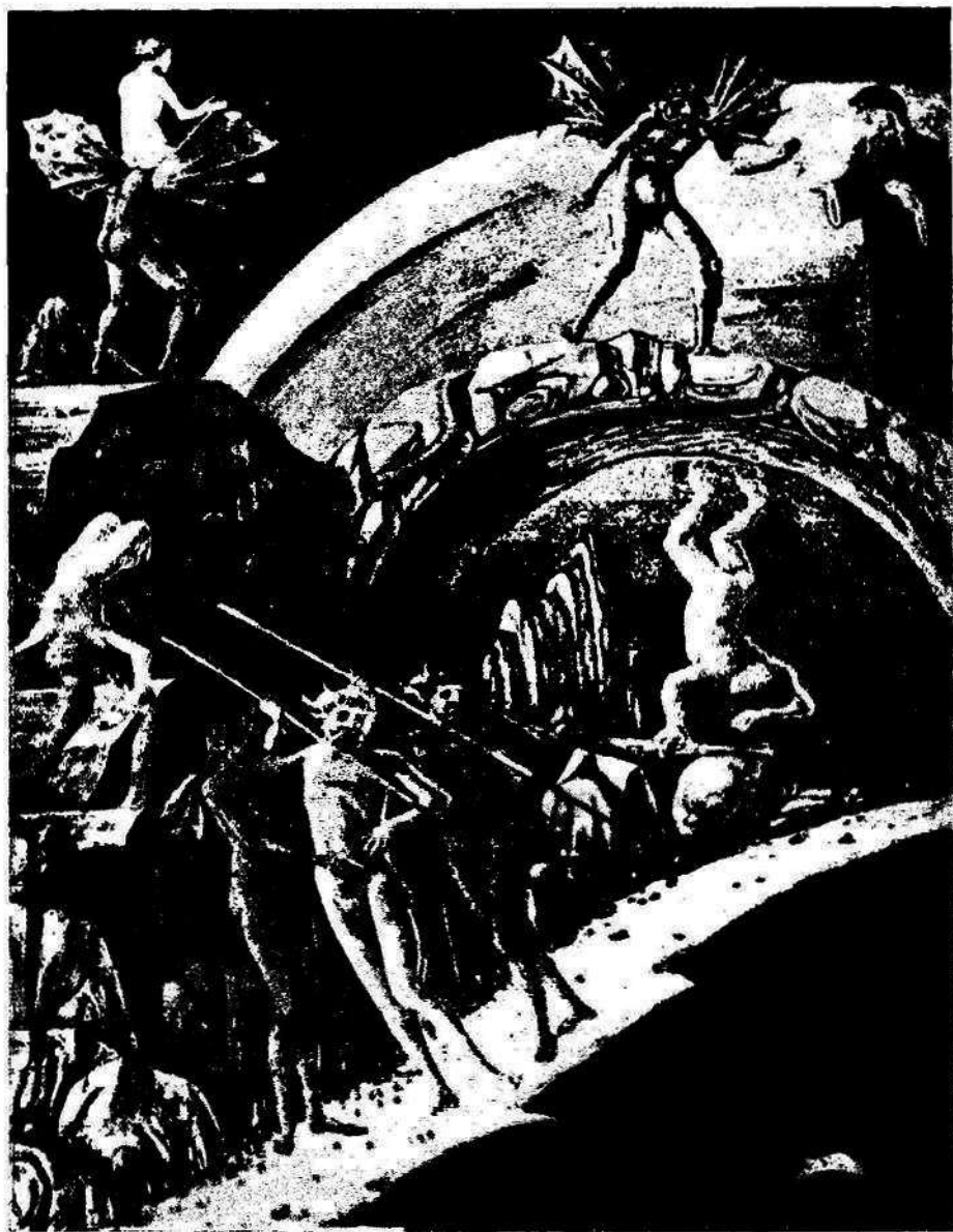
LOS DOS POETAS EN EL QUINTO CIRCULO DE LOS ESTAFADORES