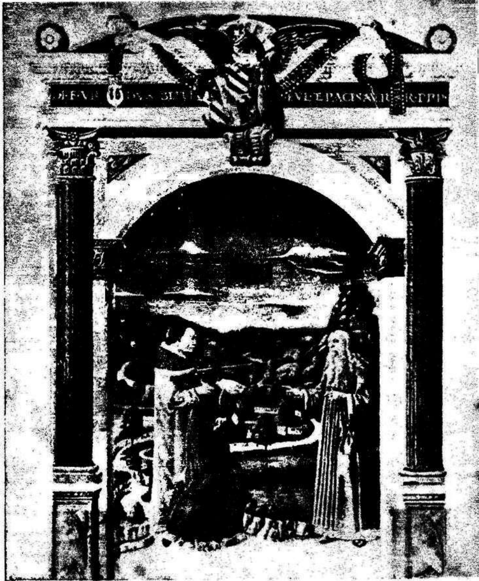
ESCENA DE LA DIVINA COMEDIA