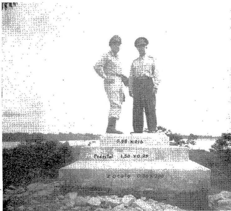
Antiguo Hito Boca Q. San Antonio.

a) El punto que marca el extremo Sur de la línea Tabatinga-Apaporis, según el Acta del cinco de diciembre de mil novecientos treinta y uno de la Comisión Mixta Colombo-Brasile-