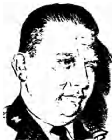
MAYOR DIEGO MANRIQUE PINTO