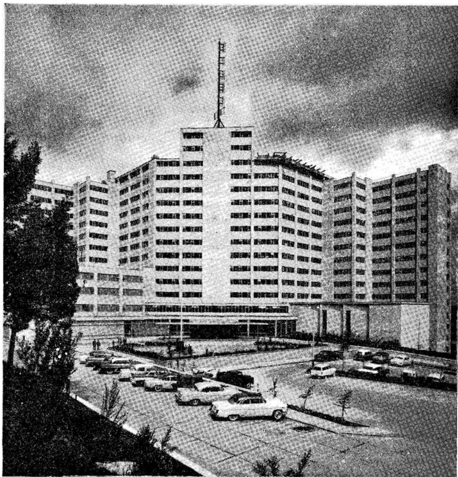
FRENTE DEL NUEVO HOSPITAL MILITAR