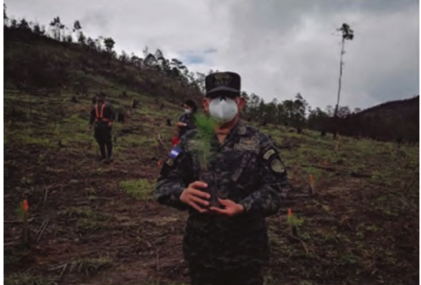
Tomada de (C-9, 2020)

país y la logística la hace parte fundamental en hacer frente a tales eventos. Del mismo modo, en torno a la defensa del Medio Ambiente a través del Comando de Apoyo al Manejo del Ecosistema y Ambiente, se realizan trabajos de protección en la Flora y Fauna; esta última, uno de los logros más destacados respecto a la