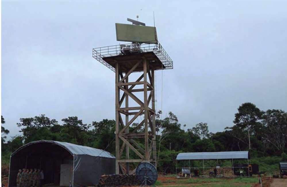
Foto: Radar TPS-70 de la Fuerza Aérea del Perú desplegado para efectuar operaciones de vigilancia, control y defensa del espacio aéreo contra el narcotráfico en la selva.

Durante esta emergencia, la Fuerza Aérea del Perú también empleó su capacidad de inteligencia, vigilancia y reconocimiento con aeronaves y con el satélite PerúSat-1, para la obtención de imágenes en el monitoreo de las áreas afectadas, lo que facilitó a las autoridades la toma de decisiones ante la emergencia presentada.