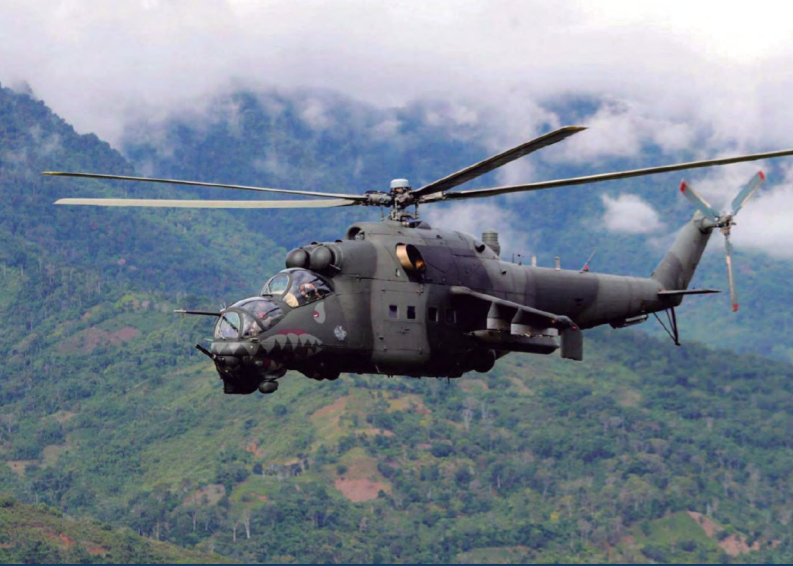
Foto: Helicóptero de ataque Mi-25 de la Fuerza Aérea del Perú.