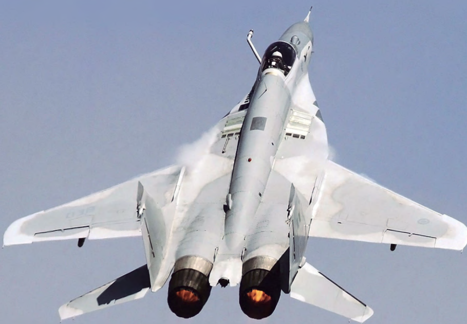
Foto: Caza interceptor Mig-29 de la Fuerza Aérea del Perú.

⊕ La Fuerza Aérea del Perú tiene capacidades operacionales que le permiten contribuir, dentro de su ámbito de competencia, a la seguridad multidimensional; no obstante, requiere renovar su material de aviación de combate y de defensa aérea para recuperar capacidades de combate.