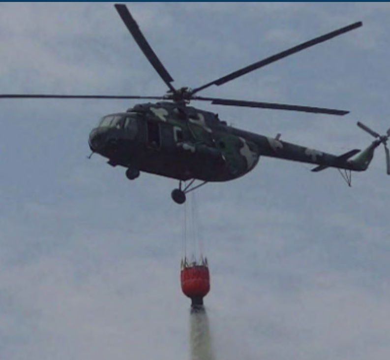
Foto: Helicóptero Mi-17 de la Fuerza Aérea del Perú efectuando una descarga de agua con el sistema Bambi Bucket o Helibalde.

empleándose para ello las capacidades operacionales de vigilancia aeroespacial (mediante el despliegue de radares en el departamento de Madre de Dios) y negación aeroespacial (mediante la ejecución de interceptaciones aéreas con aeronaves KT-1P y C-26B).