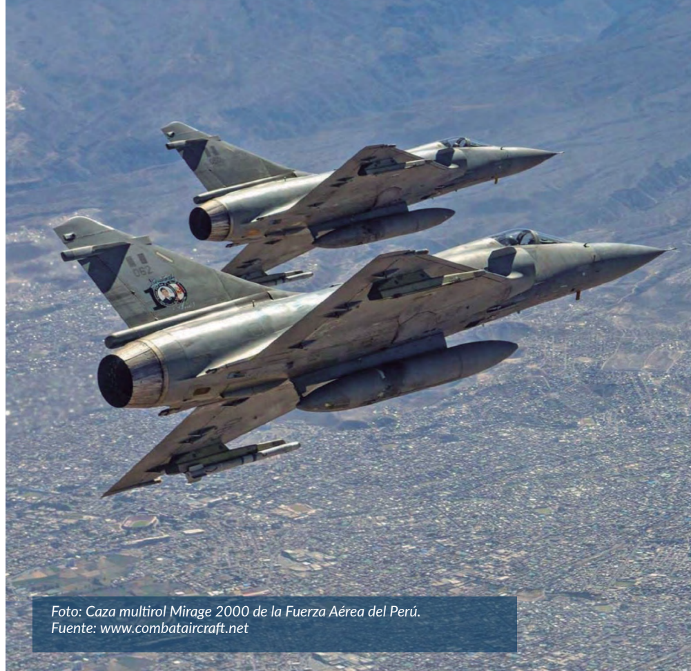
Foto: Caza multirol Mirage 2000 de la Fuerza Aérea del Perú.

Los objetivos de este artículo son los de abordar el tema de la seguridad multidimensional, explicándola en su concepto y alcance; revisar el marco legal y doctrinario que ampara el empleo de las capacidades operacionales disponibles de la Fuerza Aérea del Perú para desarrollar operaciones, en contribución a la seguridad multidimensional del país; e identificar las capacidades operacionales que se emplearon para ese propósito, en el periodo 2011-2019, lo que permitió formular