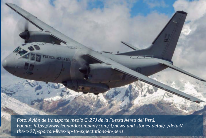
Foto: Avión de transporte medio C-27J de la Fuerza Aérea del Perú.

Como se aprecia en los párrafos precedentes, la Fuerza Aérea del Perú cuenta con un marco legal que sustenta su actuar dentro del concepto de seguridad multidimensional.