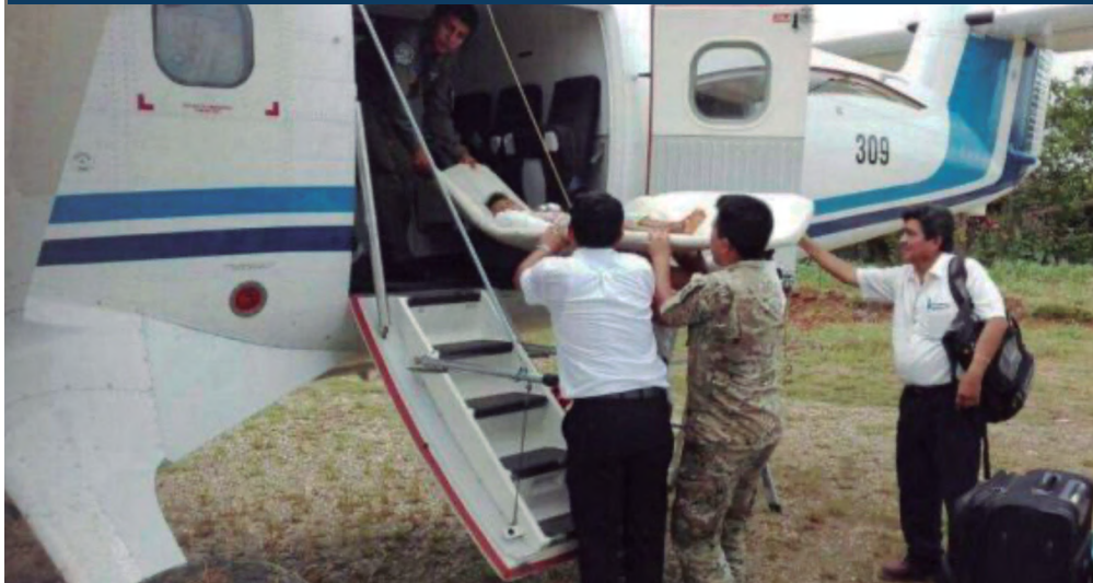
Foto: Evacuación aeromédica efectuada en un avión DHC-6 Twin Otter del Grupo Aéreo N°42 de la Fuerza Aérea del Perú.