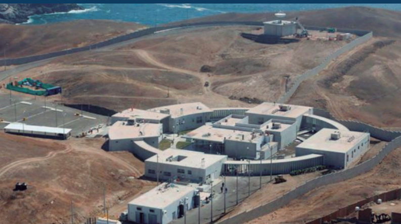
Foto: Centro Nacional de Operaciones de Imágenes Satelitales (CNOIS) ubicado en la Base Logística de Punta Lobos. Fuente: https://www.defensa.com/peru/peru-sat1-tres-anos-significativos-aportes-peru