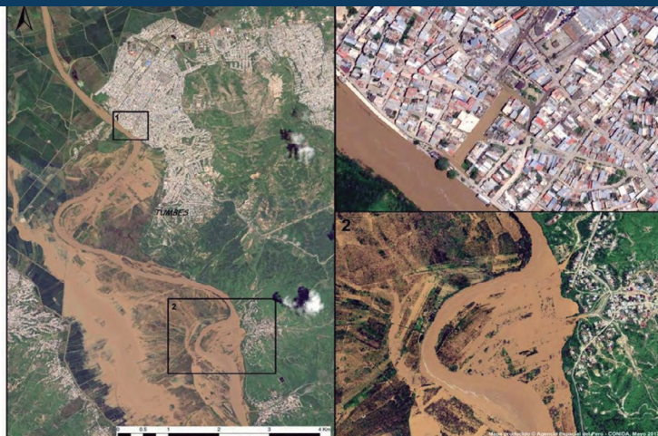
Foto: Imagen satelital tomada por el PerúSat-1 en la que se observan los daños causados por la inundaciones en la ciudad de Tumbes durante el fenómeno de El Niño Costero del 2016-17. Fuente: Comisión Nacional de Investigación y Desarrollo Aeroespacial del Perú.