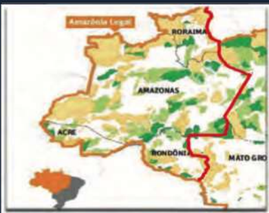
Figura 2. Comando Militar de la Amazonía – Área de responsabilidad y sus departamentos