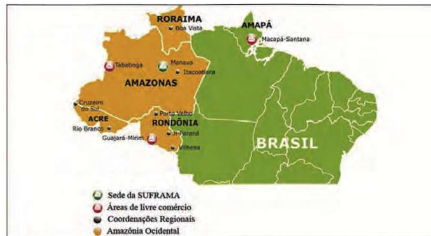
Figura 1. Amazonía Occidental (en color naranja)