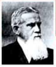
▪ Friedrich Ratzel

La geografía se divide en dos grandes ramas: la sistemática o general y la regional. 2 La geografía general se subdivide en física y humana. La geografía física es una ciencia natural, que se concentra en el estudio del paisaje natural y comprende la climatología, la geomorfología, la hidrografía, la glaciología, la edafología, la paleografía, la geografía matemática y la biogeografía, entre otras. 3