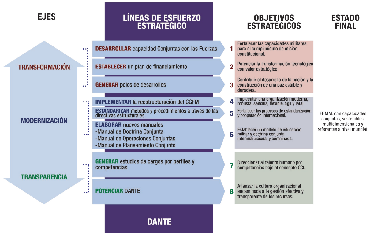
Figura 2. Ejes del Concepto Estratégico de las FMM. Basada en Comando de las FMM