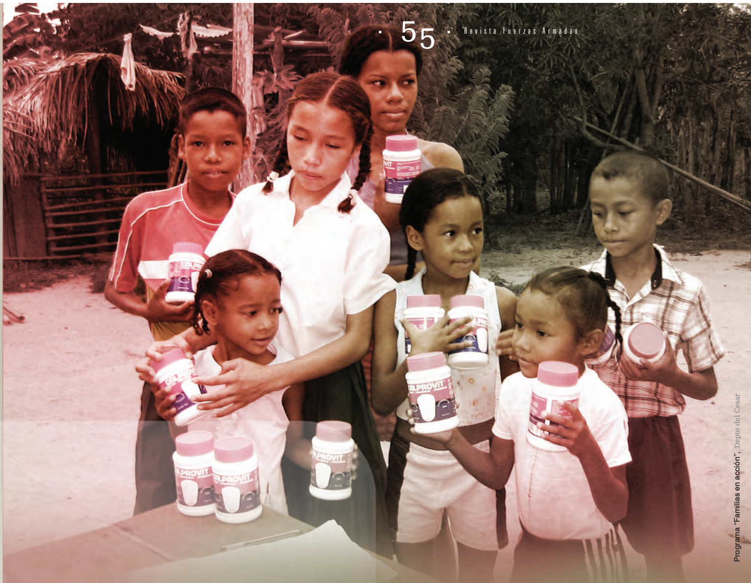
Programa "Familias en acción", Depto del Cesar

Familias en Acción, programa que consiste en la entrega de subsidios monetarios condicionados a controles periódicos de peso y talla, y a la asistencia escolar de los niños menores de 18 años, cuenta con una apropiación para el año 2008 por recursos equivalentes a 718.7 mm de pesos. La meta de Familias en Acción es alcanzar una cobertura de 1.500.000 familias en este año.