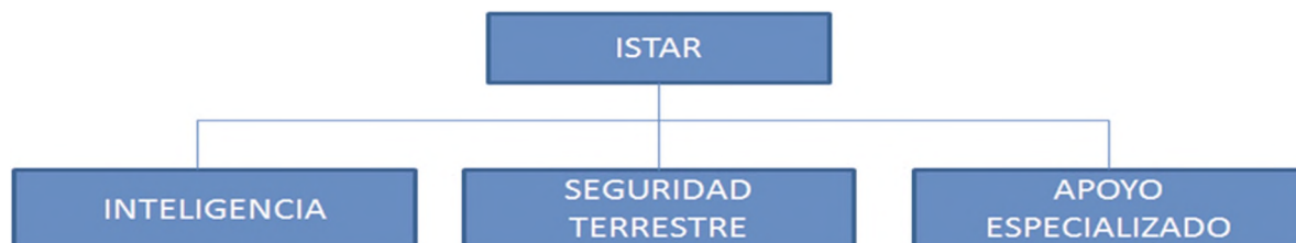
Figura 2: "Organización unidad ISTAR"

Terrestre, desarrollada por la División Doctrina, ha internalizado el impacto y las repercusiones que involucra la modernización institucional, impulsando una actualización integral de los textos que contienen los procesos de conducción y empleo del Poder Terrestre, lo cual conlleva necesariamente una nueva forma de prepararnos y enfrentar el nuevo escenario que representa el campo de batalla moderno. Frente a toda esta