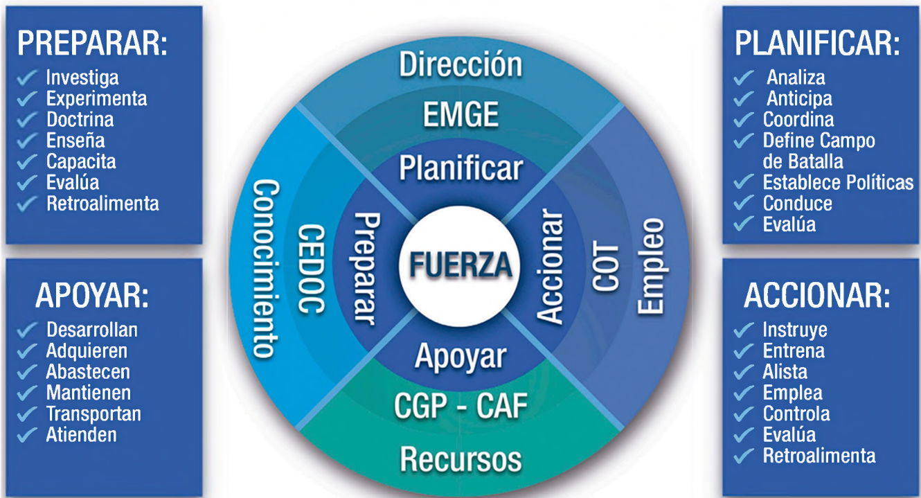
Figura 3: "Objetivos de las Funciones Matrices del Ejército"