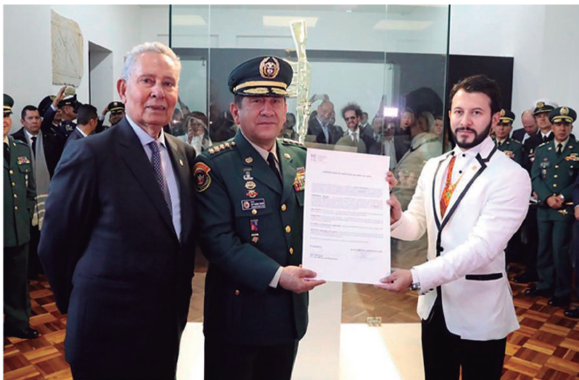
Foto: Entrega de la obra de arte “Metamorfosis”, del artista colombiano Alex Sastoque, al Museo Militar.

La Jefatura actualmente se encuentra trabajando en articular y orientar la elaboración