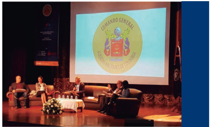
Foto: I Foro Internacional de Justicia y Memoria, celebrado el 8 de junio del 2017. Teatro Patria. ▲

Por lo anterior, se hizo necesaria la creación de políticas y lineamientos que permitieran la organización de dependencias dedicadas al estudio de la participación de las Fuerzas Militares en el marco del conflicto armado, conformadas por profesionales en ciencias sociales, políticas, económicas y militares. Dicha organización se vio replicada en las diferentes Fuerzas, donde se buscó hacer un esfuerzo por dar cumplimiento a lo ordenado por el Comando General de las Fuerzas Militares.