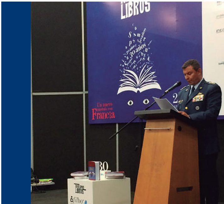
Foto: General Carlos Eduardo Bueno Vargas, Comandante Fuerza Aérea Colombiana. Archivo institucional (2017).

los enormes sacrificios y retos que tuvieron que enfrentar a lo largo de un conflicto degradado e irregular como el colombiano. Así lo señala el Comandante de la Fuerza Aérea Colombiana en el prólogo del libro, y en las palabras formales de lanzamiento en la FILBO 2017, en las que el General Carlos Eduardo Bueno Vargas señala el apego irrestricto de la Institución al DIH y la búsqueda constante por la modernización y racionalización de su actuar: