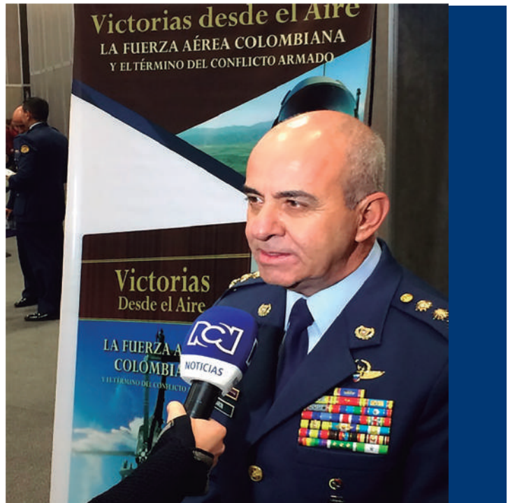
Foto: Mayor General Luis Ignacio Barón Casas, Segundo Comandante Fuerza Aérea Colombiana. Archivo institucional (2017). ▲

Cualquier trabajo de memoria que se adelante dentro de las Fuerzas Militares debe guardar estas calidades y rigurosidades; finalmente, la experiencia de la publicación, y de los eventos académicos que se han desarrollado a partir de la misma, da cuenta de la receptividad de