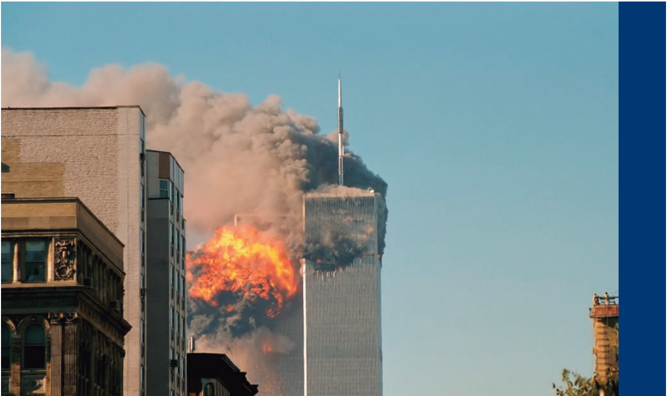
Foto: http://curiosidades.com/las-fotos-mas-impactantes-del-11-de-septiembre/ ▲

tiene desde la misma organización que rige la actuación de los Estados individualmente y en conjunto para combatir las 'nuevas amenazas'. La primera fue la Convención Internacional de 2004 durante la cual se dictaron y se establecieron las categorías de interferencia ilícita de aviación. En este punto fueron cuatro categorías que definían la forma como actores ilegales no estatales podrían interferir en la soberanía del territorio aéreo de los Estados (Bachini, 2002).