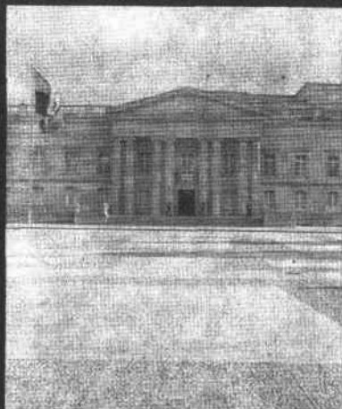
PALACIO DE NARIÑO

EDITADA BAJO LA DIRECCION DE LA ESCUELA SUPERIOR DE GUERRA