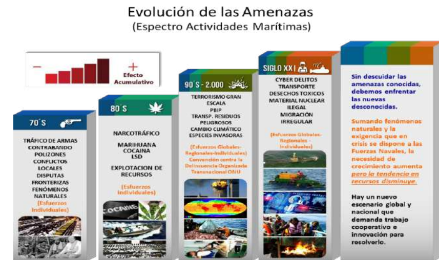
Figura 1. Evolución de las amenazas