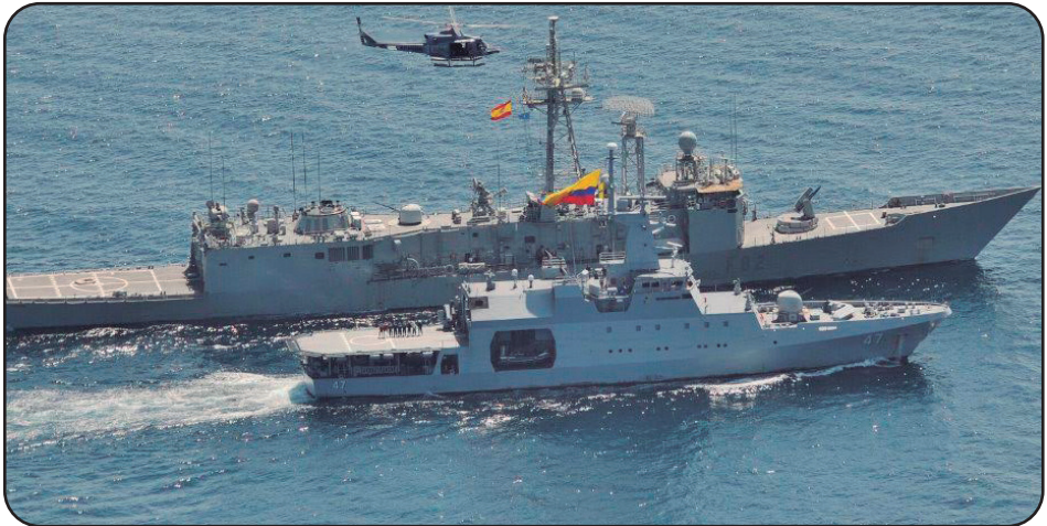
Figura 4. Ejercicios Navales "ESPS Victoria" V.S. "ARC 7 de Agosto". Costa de Somalia-Operación Atalanta