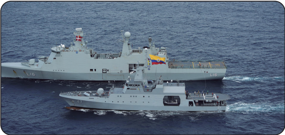
Figura 6. Ejercicios de Entrenamiento “HDMS Abasalon” V.S. “ARC 7 de Agosto”.