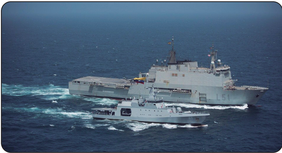
Figura 3. Rendezvous "ESPS Galicia" V.S. "ARC 7 de Agosto". Costa de Somalia-Operación Atalanta.