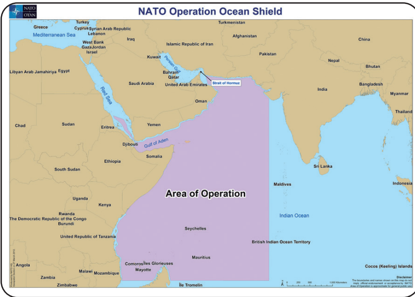
Figura 5. Área de Operación Ocean Shield.

De la misma manera, la Operación Escudo del Océano ( Operation Ocean Shield ) fue la contribución de la OTAN a la Operación Libertad Duradera en el Cuerno de África (OEF-HOA), una iniciativa contra la piratería en el Océano Índico, el Canal Guardafui, el golfo de Adén y el mar Arábigo. En 2008, a pedido de las Naciones Unidas, la OTAN comenzó a apoyar los esfuerzos internacionales para combatir la piratería en el Golfo de Adén, frente al Cuerno de África y en el Océano Índico, desde agosto de 2009, la OTAN dirigió la Operación Ocean Shield, que permitió contribuir a disuadir e interrumpir los ataques piratas, al tiempo que protegía los buques y coadyubaba a aumentar el nivel general de seguridad en la región. La OTAN trabajó en una muy estrecha cooperación con diferentes actores en el área, como la Operación Atalanta de la Unión Europea, la Fuerza de Tarea Combinada 151 liderada por Estados Unidos y apoyos navales de otros países en forma individual. Sin ataques exitosos de piratería desde 2012, la OTAN puso término a la Operación Ocean Shield el 15 de diciembre de 2016, NATO-OTAN (2016).