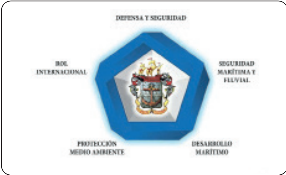
Figura 2. Vértices de la Estrategia Pentagonal.