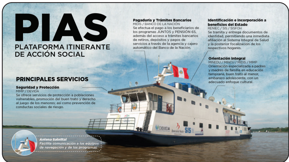
Figura 2. PIAS Características

Las PN- PIAS, tienen las siguientes características conforme a la Figura 7: