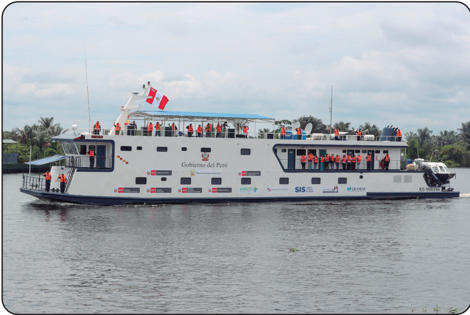
Figura 1 PIAS Río Morona

MIDIS. El nuevo enfoque consideraba un esquema de intervención estatal multisectorial montado sobre Plataformas Itinerantes de Acción Social (PIAS) figura 6, apoyado en Plataformas Locales (Infraestructura y Comités Locales) y en Plataformas de Soporte (TIC's).