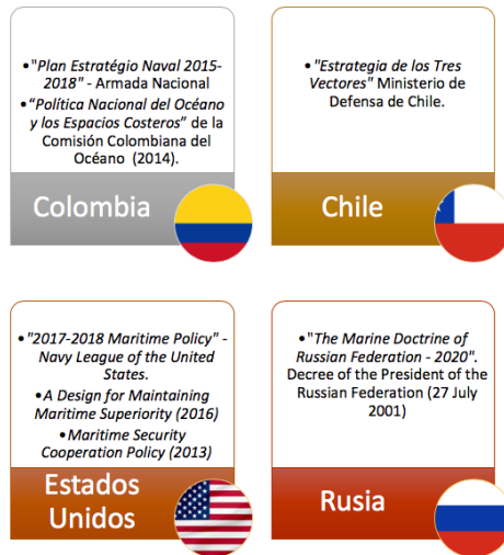
Figura 2. Estrategias Marítimas actuales de los casos de estudio.

Como primera medida, es necesario especificar las Estrategias Marítimas actuales que tiene cada país, para lo cual se señalan los principales documentos encontrados (Figura 2).