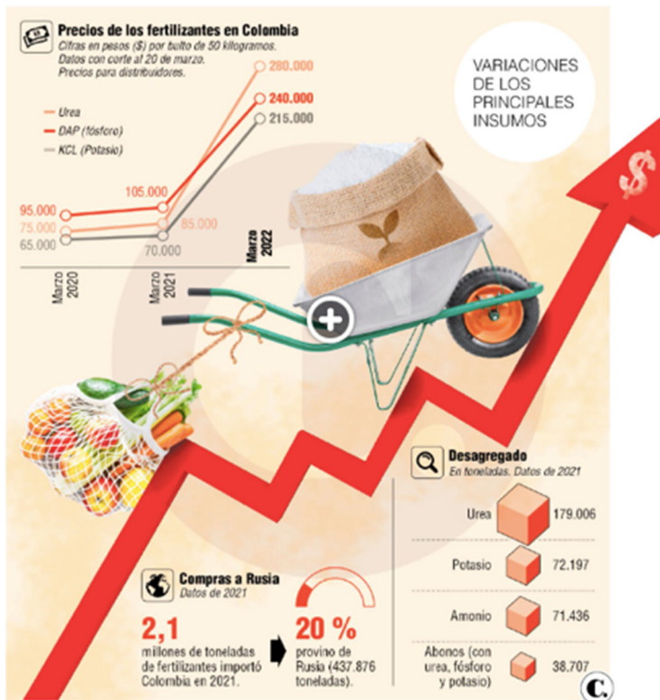
Figura 2. Influencia de los fertilizantes en Colombia