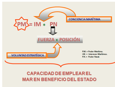
Fig.1. Poder Marítimo.