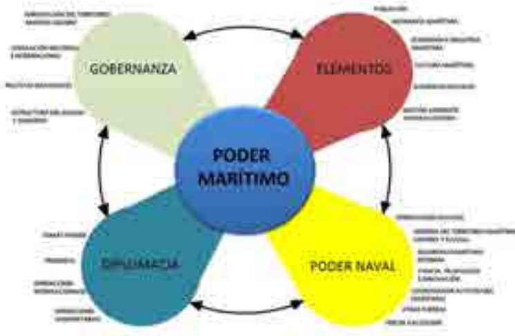
Figura 4. Poder Marítimo para Colombia y sus componentes (Elaboración Propia)

Cabe resaltar que este sistema requiere de la voluntad de actores estratégicos, sobre todo políticos, que impulsen compromisos, políticas, programas, planes y proyectos en beneficio del desarrollo marítimo. Es decir, fortalecer el compromiso de actores estratégicos en el fortalecimiento del Poder Marítimo como Objetivo Nacional.