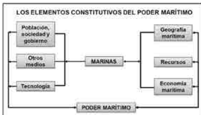
Gráfica 3 Elementos constitutivos del Poder Marítimo