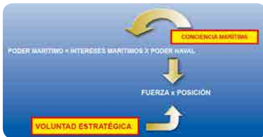
Figura 1 Elementos del Poder Marítimo

En la Figura 1 Elementos del Poder Marítimo, se presenta el resumen de la composición de la teoría chilena y la relación del Poder Marítimo con el Poder Naval, la cual ha sido adoptada por la Armada de Colombia.