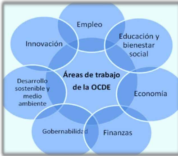
Figura 1. Áreas de trabajo de la OCDE