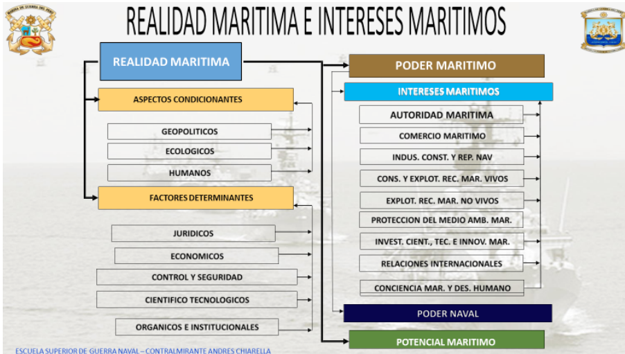
Figura 3. Realidad marítima e intereses marítimos

ESCUELA SUPERIOR DE GUERRA NAVAL – CONTRALMIRANTE ANDRÉS CHIARELLA