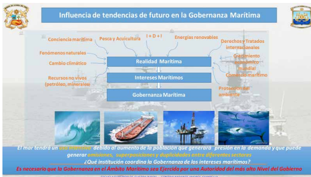
Figura 5. Influencia de tendencias de futuro en el Gobernanza Marítima.