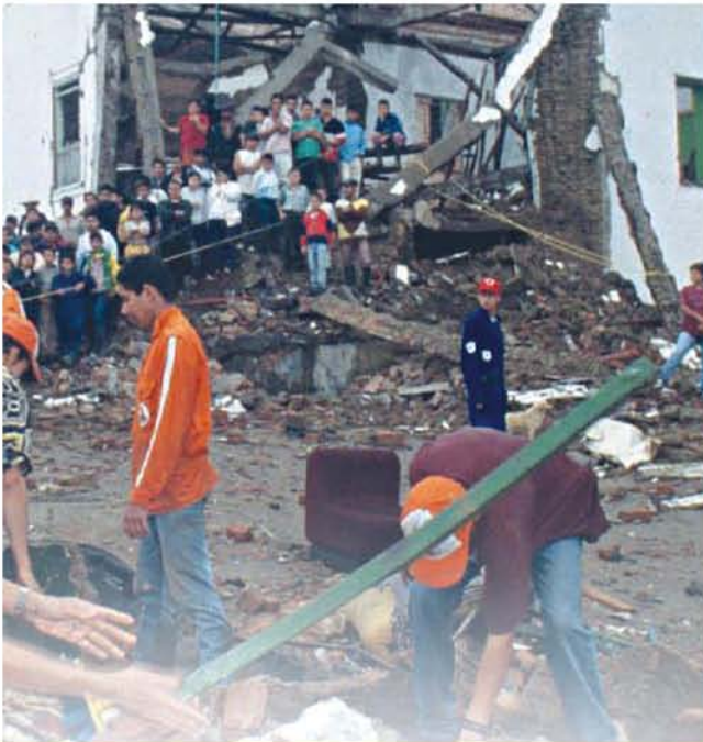
[i] Capacidad de engaño.

Auc. Apparently the demobilization process receives all the interest from the organization, which has given samples of its intention to keep it active in front of the ultimatum from the Government in moments of crisis. However, the reality of these intentions can only be considered when the judicial process starts with the amendments of the "peace and justice law", and some of their leaders will be facing an extradition petition. Therefore, it is not well known the magnitude of the structure supporting the organization, and it is not possible to assess the demobilization magnitude regarding its real armed potential. Auc keep a high capacity to trick the government risking the process and the security environment of the country.